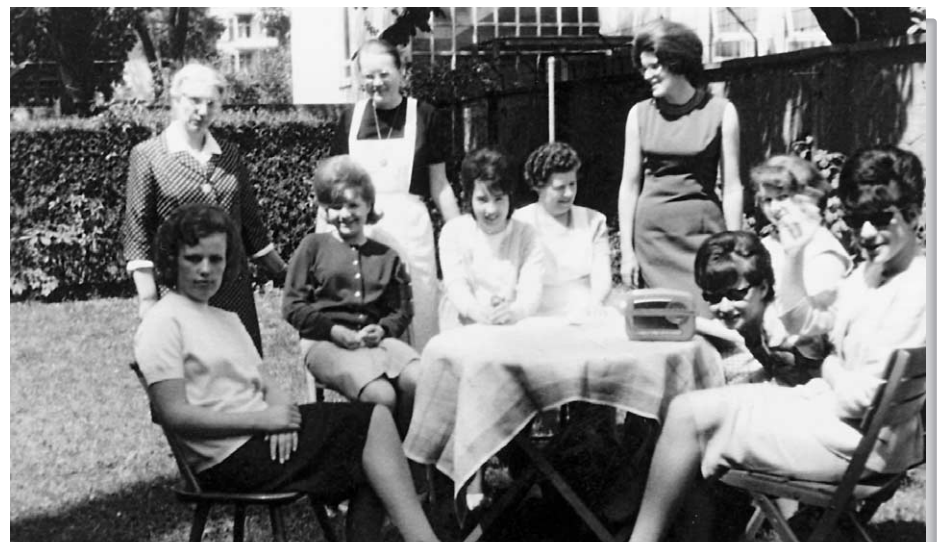
Entspannung im Garten, 1957

Nach dem Ersten Weltkrieg entwickelten sich die »Anstalten« durch den Einfluss der Reformpädagogik zu Heimen mit meist erzieherischen Auftrag, so auch bei dem im Nachbarhaus untergebrachten Luisenheim. Arbeit und Unterkunft zu finden wurde zunehmend schwieriger und die Frauen wohnten entsprechend länger im Haus. Die Arbeit musste sich immer wieder neu den aktuellen Notlagen der Frauen anpassen, sei es Versorgung von Kriegsflüchtlingen, Integration von haftentlassenen oder »gefallenen« oder Stabilisierung von psychisch auffälligen Frauen. Der versorgende Heimcharakter blieb noch viele Jahre erhalten. Die mit den Frauen im Haus woh-